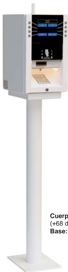
Cuerpo: 475 x 291 x 365 mm. (+68 de antena) Base: 1121 x 226 x 320 mm.